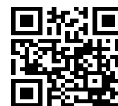
QRC Notice complète